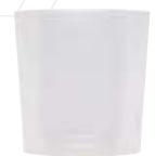
Kerzenbecher für Stumpen 60x50mm

Weitere Informationen zum Zubehör für Osternachtkerzen finden Sie in unserer Preisliste auf Seite 6.