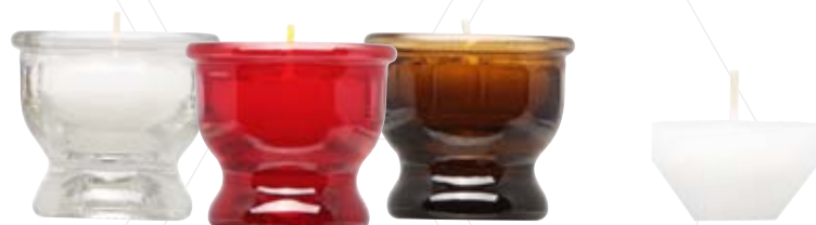
Glasopferlicht Nr. 4 farblos, ca. 6 h