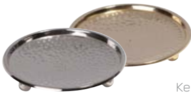
Kerzenteller vernickelt 110mm, Nr. 12084