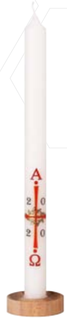
Nr. 12 250x19mm [mit Zahl]

Weitere Informationen zu Osternachtkerzen finden Sie in unserer Preisliste auf Seite 6.