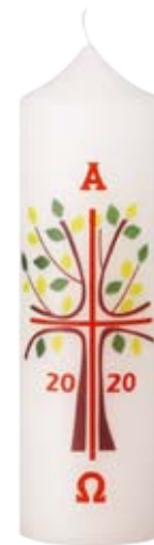
Nr. 808 200x60mm

Weitere Informationen zu Ostertischkerzen finden Sie in unserer Preisliste auf Seite 6.