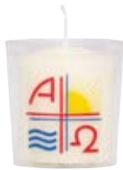
Nr. 59 o.Z. 60x50mm