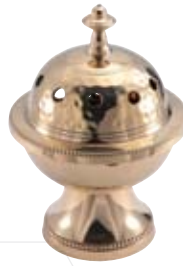
Tischweihrauchfass Messing 130mm Höhe