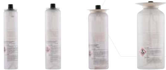
100ml 125ml 160ml 280ml

Attrappen gibt es in allen gängigen Altarkerzengrößen ab 200mm Länge und 40mm Durchmesser in Nylon oder in PVC. Bei der Bestellung geben Sie bitte an, welchen Einsatz Sie benötigen: Zeiger-Immergrad [Federrohr plus Einsatzkerzen], Acryllux-Nachfülldosen oder Ewigbrenner. Die Acryllux-Nachfülldosen werden mit Flüssigparaffin selbst befüllt. Bitte beachten Sie: Alle Attrappen-Systeme werden auftragsbezogen nach Ihren Wünschen gefertigt und benötigen deshalb eine entsprechende Lieferzeit! Weitere Informationen siehe Preisliste Seite 10.