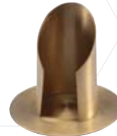
Rohrleuchter messing 50mm, Nr. 10975