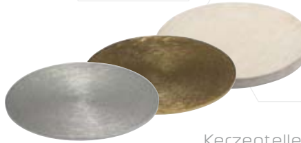
Kerzenteller silber gebürstet 100mm, Nr. 12056