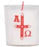
Nr. 61 o.Z. 60x60mm [bedr. Becher]