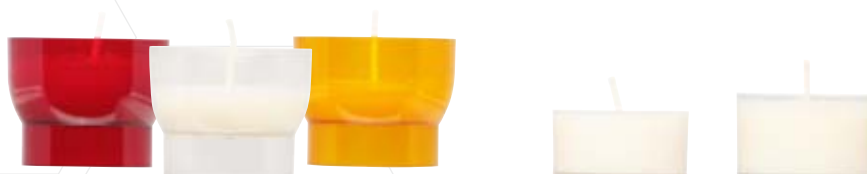
Opferlicht Nr. 211/20 ca. 6 h