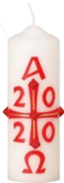
Nr. 1 150x50mm

Ostertischkerzen im Einzelkarton mit kleinen Osternägeln [Nr. 1 und Nr. 2 bedruckt mit zusätzlichem Goldstreifen]