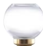
Ersatzglas Kugelform messing