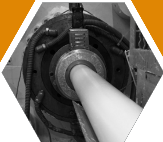
Gepresste Herstellung von Kerzen