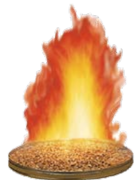
Osterfeuer Schale mit alkoholischer Brennpaste ø 300mm