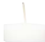
Nachfüller Nr. 10 ca. 4,5 h