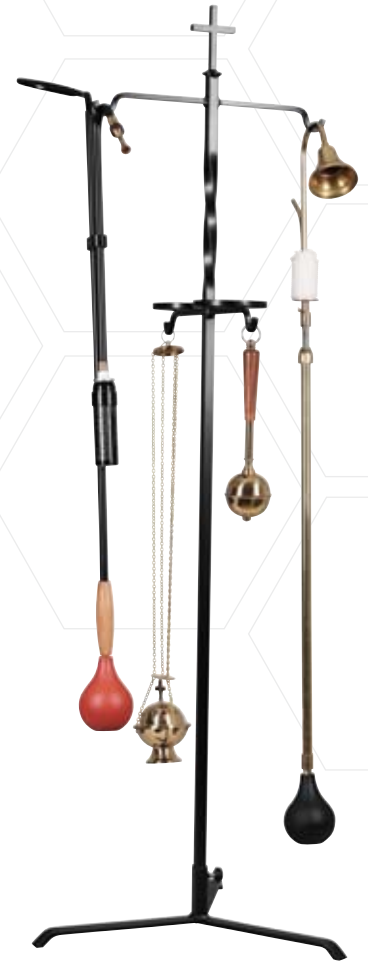
Stummer Diener mit Zubehör

Der Gasanzünder besteht aus einem Anzünd- und einem Löschstab. Mit Hilfe des Ringlöschers können Sie die Kerzen in Ihrer Kirche problemlos auslöschten, auch in größerer Höhe. Ersatzteile und Erweiterungen wie Verlängerungsstab, Blasebalg, Düsenkopf, Klemmhalterungen und Gasampullen können auch einzeln bestellt werden.