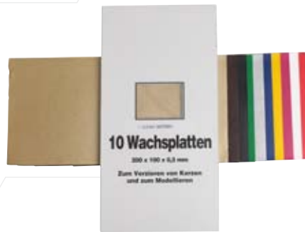
Verzierwachsplatten Farben sortiert [10er Pack]