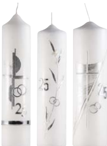
Nr. 951 265x60 mm Nr. 442 250x60 mm Nr. 843 250x70 mm