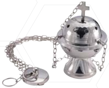
Rauchfass Nickel mit Kreuz und Kette 130mm Höhe