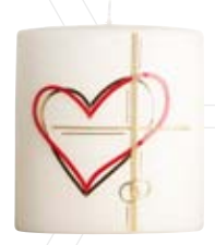
Nr. 409 150x135x70 mm

Zusätzliche Modelle bieten wir Ihnen in unserem Onlineshop unter www.kerzenschloesser.de oder in unserem Einzelhandel an. Eine Personalisierung der Kerzen mit Namen und Datum ist gegen Aufpreis möglich. Passende Kerzenteller können Sie auf Seite 30 auswählen. Weitere Informationen zu Hochzeitskerzen finden Sie in unserer Preisliste auf Seite 8.