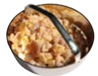
Weihrauch Granen natur