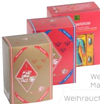
Weihrauchpaket verschiedene Sorten [500g]