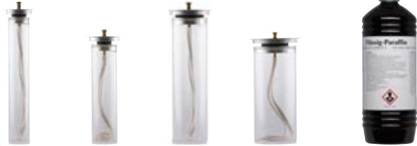
Ø 25mm Ø 30mm Ø 40mm Ø 50mm 1-Liter Flasche Flüssigparaffin