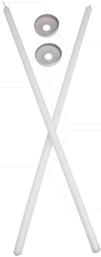
Blasiuskerze gerade Ausführung inkl. Papptropfteller

Weitere Informationen zu Lichtmess- und Blasiuskerzen finden Sie in unserer Preisliste auf Seite 3.