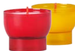
Opferlicht Nr. 35 rot, ca. 5,5 h

Hüllen werden vom Hersteller neu befüllt