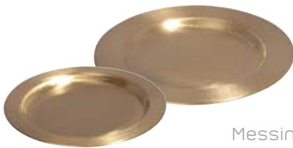
Messingteller leicht 110mm, Nr. 10122A