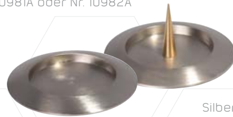
Silberteller matt 120mm oder 140mm, Nr. 12981 oder Nr. 12982