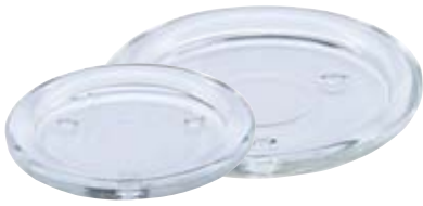
Glasteller klein 110mm, Nr. 540026