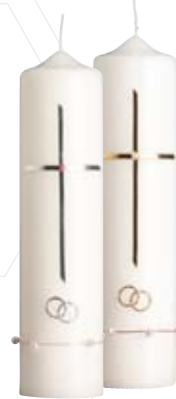
Nr. 413 silber 250x60 mm Nr. 413 gold 250x60 mm