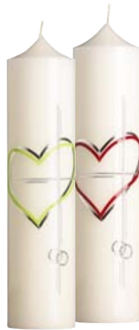
Nr. 412 grün 300x70 mm Nr. 412 rot 300x70 mm