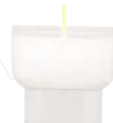
Opferlicht Nr. 80 farblos, ca. 9 h

Weitere Informationen zu umweltfreundlichen Opferlichtern finden Sie in unserer Preisliste auf Seite 4.