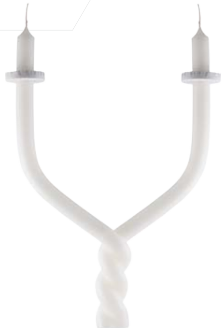
Blasiuskerze gedrehte Zwiangel einschließlich Papptropfteller