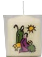
Nr. 443 im Becher dargestellt