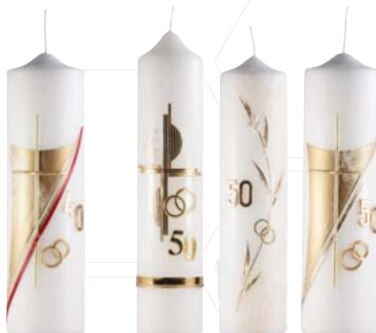
Nr. 843 250x70 mm Nr. 951 265x60 mm Nr. 442 250x60 mm Nr. 843 250x70 mm