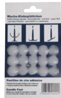
Wachsklebe- plättchen [VE 15]