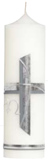
Nr. 219 300x80 mm

Für Trauergespräche und -besuche, für Exequien bzw. Trauerfeiern. Zusätzliche Modelle finden Sie in unserem Onlineshop www.kerzenschloesser.de oder in unserem Einzelhandel. Weitere Informationen zu Trauerkerzen finden Sie in unserer Preisliste auf Seite 9.