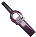
Feuerzeuge in verschiedenen Farben