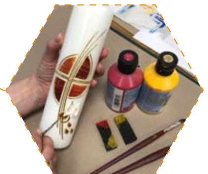
Einblick in unsere Verzierabteilung

Weitere Informationen zu Firm- und Pfingstkerzen finden Sie in unserer Preisliste auf Seite 7.