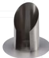
Rohrleuchter silber 50mm, Nr. 12975