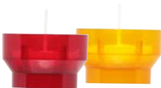
Opferlicht Nr. 10 D rot, ca. 3 h