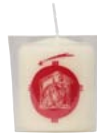
Nr. 2075 im Becher dargestellt