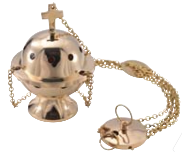
Rauchfass Messing mit Kreuz und Kette 130mm Höhe