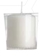
Lichtmesskerze Nr. 18 im Becher 60x50mm