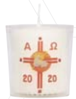
Nr. 62 m.Z. 60x60mm [bedr. Becher]