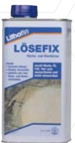
LÖSEFIX Wachsentferner für Stein (1000ml)