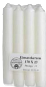
Einsatzkerzen 170x23 mm, 8er Pack