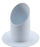
Rohrleuchter weiß 40mm, Nr. 10474