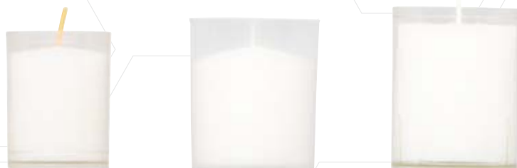
Stundenbrenner Nr. 24 ca. 18 h