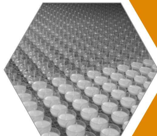
Maxilicht Aluminium ca. 9 h