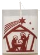
Nr. 1814 gefüllter PC-Becher

Weihnachtskerzen mit Siebdruck / Transferdruck