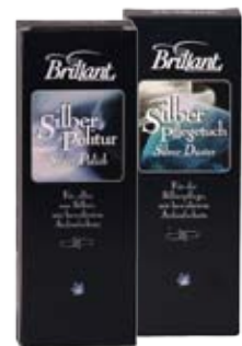
Silber Politur (250ml)