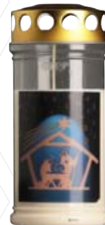
Nr. 445 ca. 4 Tg.