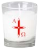
Nr. 58 o.Z. 62x48mm Osterglas