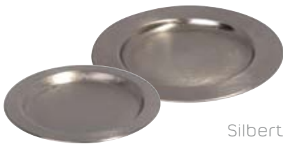
Silberteller leicht 110mm, Nr. 12122