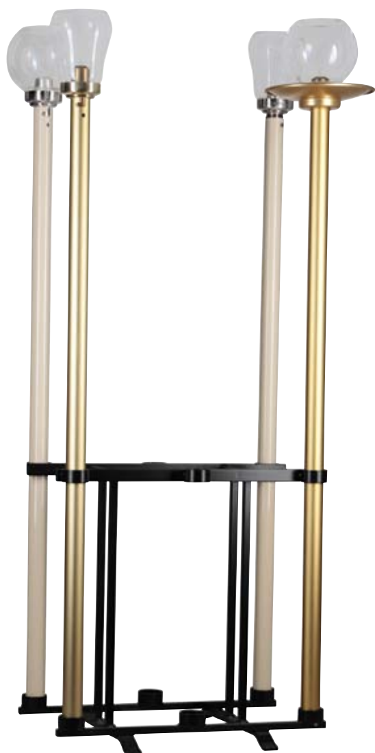
Aufbewahrungsständer für Trageflambeaux