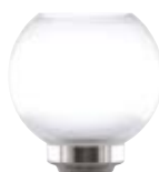
Ersatzglas Kugelform nickel