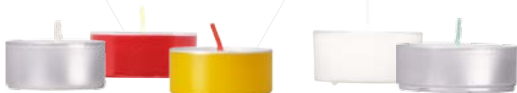
Opferlicht Nr. 8 ca. 4,5 h