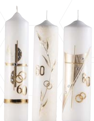
Nr. 951 265x60 mm Nr. 442 250x60 mm Nr. 843 250x70 mm

Weitere Informationen zu Jubiläumshochzeitskerzen finden Sie in unserer Preisliste auf Seite 8.