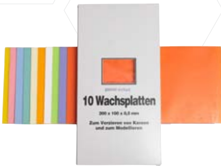
Verzierwachsplatten pastell sortiert [10er Pack]