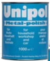
Unipol Metallpolitur (1000ml Dose)

Weitere Informationen zu Reinigungsmitteln und ihrer Anwendung finden Sie in unserer Preisliste auf Seite 11.