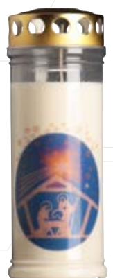
Nr. 775 ca. 6 Tg.

Weitere Informationen zu Weihnachtskerzen finden Sie in unserer Preisliste auf Seite 9.