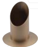
Rohrleuchter gold 40mm, Nr. 10444