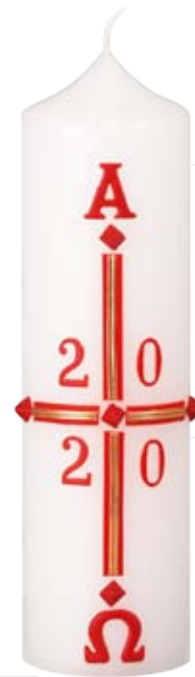
Nr. 8 250x70mm

Transferdruck, im Einzelkarton mit kleinen Osternägeln