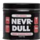
Nevr-Dull Metall- Polierwatte