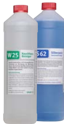
W25 Rauchfass- reiniger (1000ml)