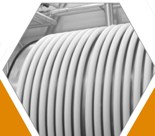
Gezogene Herstellung von Kerzen