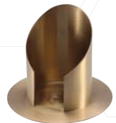
Rohrleuchter messing oder silber 80mm, Nr. 10978 oder 12978

Weitere Informationen zu Kerzentellern und Kerzenleuchtern finden Sie in unserer Preisliste auf Seite 11.