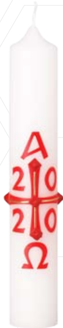
Nr. 2 250x40mm