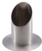
Rohrleuchter silber 40mm, Nr. 12444